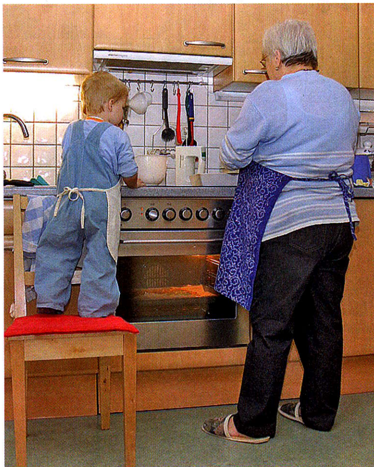
Schön, wenn Kinder aus schwierigen Familienverhältnissen bei ihren Großeltern ein Stück Normalität erleben können.

Viele Informationen zum Thema „Wenn Eltern psychisch krank sind“ bietet die Internetseite www.netz-und-boden.de . Dort gibt es auch eine Literaturliste mit Büchern für Erwachsene und Kinder. Das Bilderbuch „Fu-fu und der grüne Mantel“ zum Beispiel von Vera Eggermann und Lina Janggen beschäftigt sich mit der kindlichen Auseinandersetzung mit dem befremdenden Verhalten eines psychisch kranken Elternteils - allerdings ohne die Zusatzproblematik der Trennung.