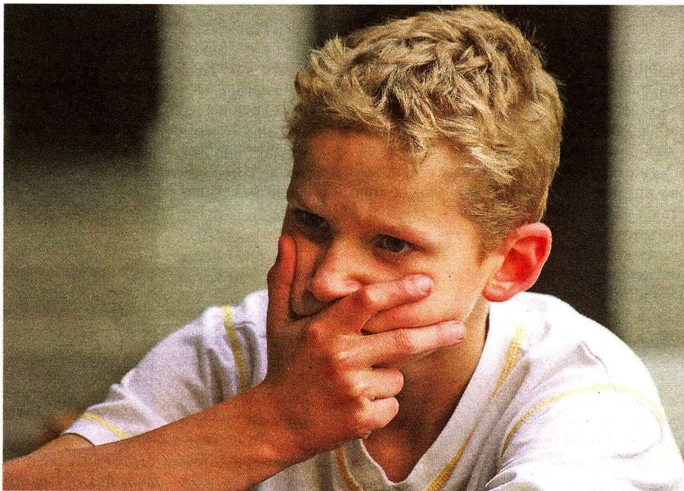
Schnell ist einem ein Fehler unterlaufen. Und dann? Zugeben oder abstreiten?

A ntwort: Dass Ehrlichkeit ein sehr wichtiges Erziehungsziel ist, darin kann ich Ihnen nur zustimmen. Ein solches Ziel zu erreichen, braucht allerdings auch seine Zeit. Sie selber betonen, wie hoch Ihre Ansprüche sind. Es könnte gut sein, dass Ihr Sohn diese auch schon verinnerlicht hat. Vermutlich war ihm sein Fehler deshalb auch sehr peinlich. Wenn Ihr Sohn nun auch den hohen Anspruch hat, keinen Fehler machen zu dürfen und machen zu wollen, so steckt er schnell in einem Dilemma. Wenn einem nämlich etwas passiert, was den Ansprüchen nicht genügt, leugnet man sein Fehlverhalten leicht nach dem Motto: „Was nicht sein darf, kann nicht sein.“ Hat man